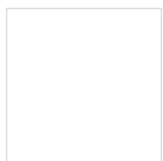
Alvarinho Pouco-Comum 2011